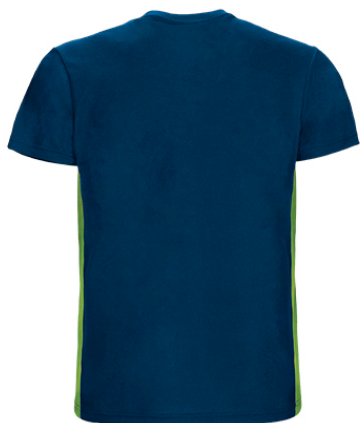
Vista posteriore del capo