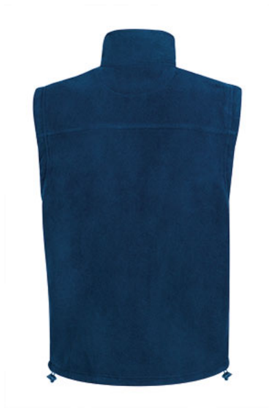
Vista posteriore del capo