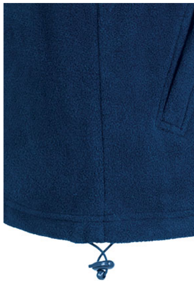
Dettaglio cordone regolabile con freno in fondo