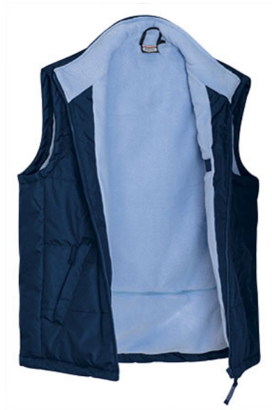
Dettaglio interno in tessuto pile a contrasto