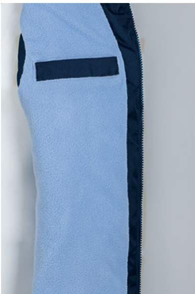
Dettaglio tasca interna in petto a sinistra