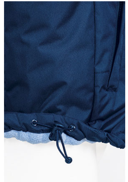
Dettaglio cordone regolabile con freno in fondo