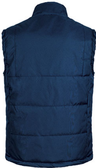
Vista posteriore del capo