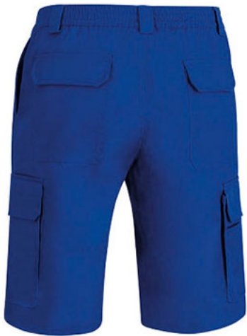
Vista posteriore del capo