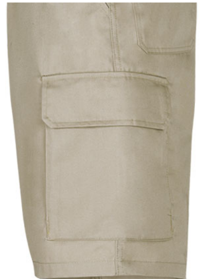
Dettaglio tasca laterale