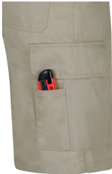
Dettaglio tasca laterale con accessorio porta cutter