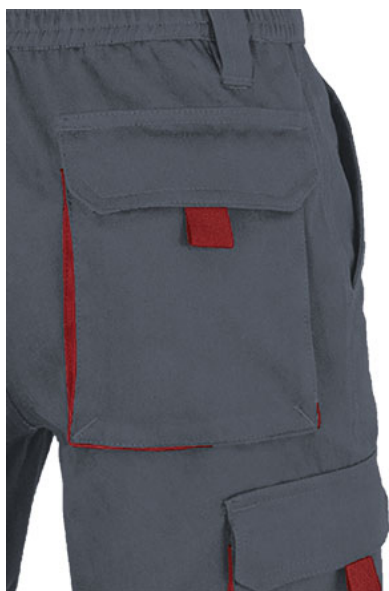
Dettaglio tasca laterale