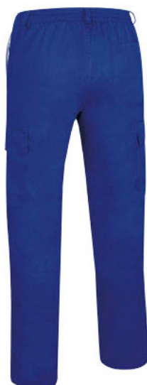
Vista posteriore del capo