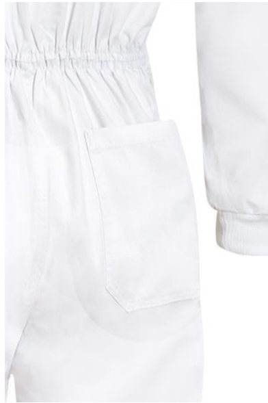
Dettaglio tasca posteriore a destra