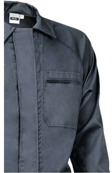
Dettaglio tasca in petto a sinistra