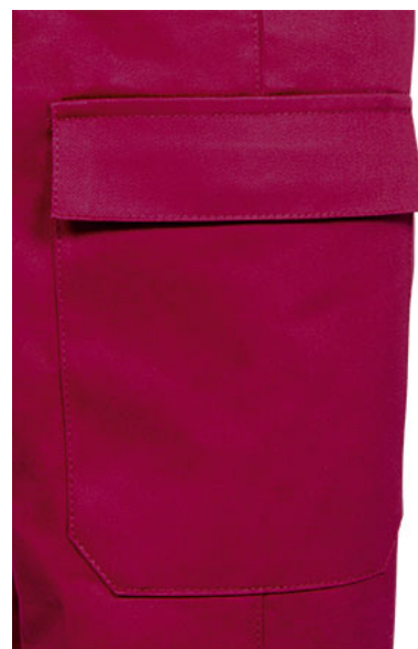
Dettaglio tasca laterale