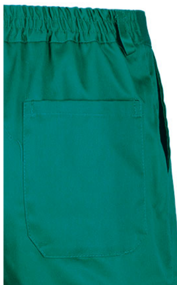
Dettaglio tasche posteriori