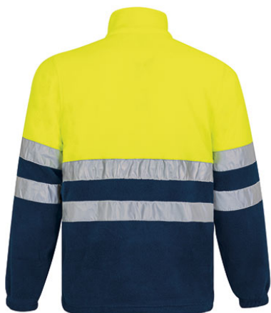
Vista posteriore del capo