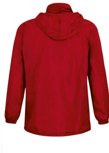
Vista posteriore del capo