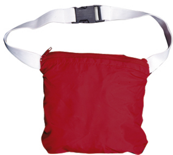
Dettaglio: giubbino riposto