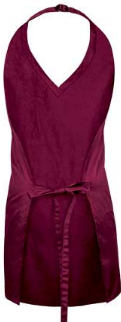
Dettaglio: vista posteriore